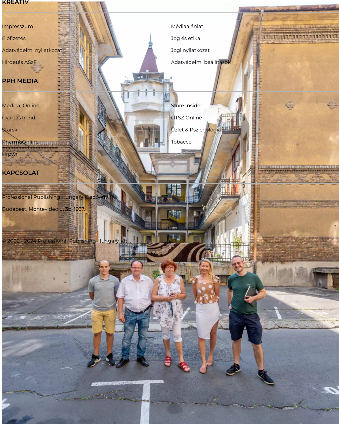
A Józsefvárosi Kolónia kedves lakóival riport közben

© 2009 - 2024 Professional Publishing Hungary Kft.