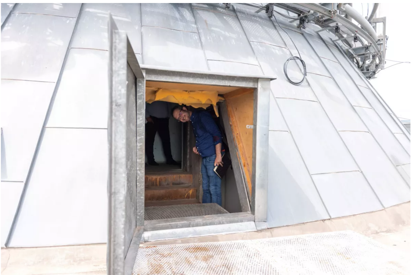
A Körszálló tetején igyekszem kifelé

...korszállóban károsultakba éppen be lehet jutni, mint száraz káoszba.