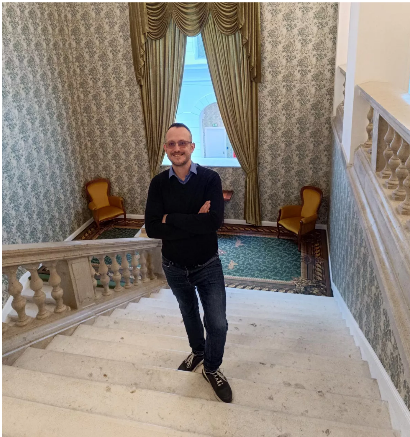
Hotely Mystery, az egykori szabadkőműves palota a Podmaniczky utcában.

Feleségemmel számos helyre néztünk már be együtt, felfedeztük a Kossuth Lajos utca egyik palotájában megbújó kézműves udvart, a romos állapotában is megkapó Pillangó házat (ha az udvarban felnéz az ember az ég felé, akkor egy pillangó formáját látja kirajzolódni), megjártuk az Ecséri piac különleges világát is. Hihetetlenül jó kalandok ezek. Az ember mindig tanul valami újat és csettint, hogy "ezek a helyek tényleg pár sarokra vannak az otthonomtól"? Tényleg. És sok esetben mindenki számára nyitottak, szabadon megnézhetőek. Tapasztalatom szerint érdemes figyelni a programajánlatokat is, mert a fővárosban rengeteg a nyílt nap, a vezetett túra, luxus szállodák lakosztályaiba énnév he lehet iutni mint színházak kulisszái mögé